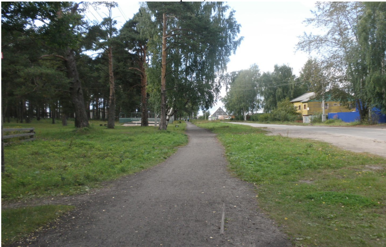
Фото общественной территории г. Шенкурск, ул. Кудрявцева (настоящее время)